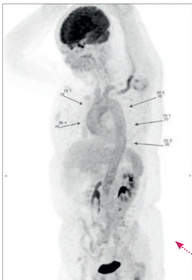
Met een PET-scan kan vasculitis zichtbaar worden gemaakt, doordat de aangetaste bloedvaten donker kleuren. Op deze PET-scan zijn de aorta en de vertakkingen door vasculitis aangetast.

Hoe wordt de diagnose gesteld? "Belangrijke hulpmiddelen daarbij zijn de PET-scan en